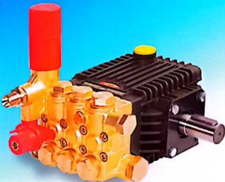
Left side built-in automatic pressure regulator